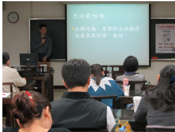
▲101/11/17 公民與社會科：「法律與道德」專題演講（中興大學法律學系許舜曉教授）