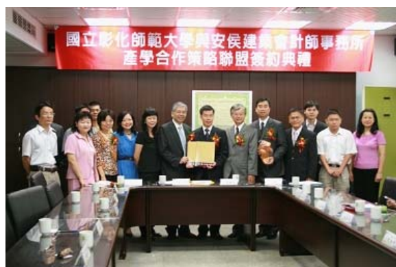
▲來賓及校內老師合照