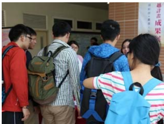
▲學生踴躍參加成果展。