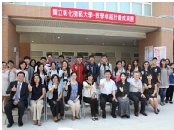
▲參加教學卓越計畫成果展開幕式師生合影。