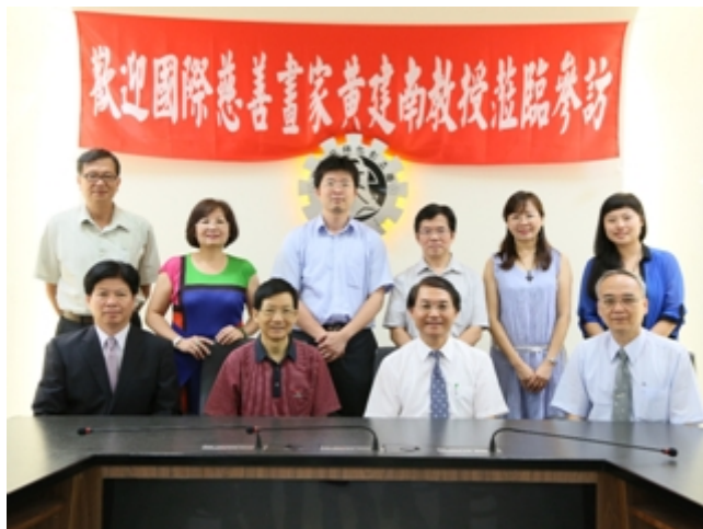
▲知名國際慈善畫家黃建南教授蒞校參訪，現場繪製畫作贈予本校誌念收藏。

著名大陸書畫家黃建南教授於 103 年 6 月 19 日抵台，展開藝術文化交流之旅，並於 6 月 25 日蒞臨本校參訪，大師遠道前來，本校郭校長艷光、李副校長清和、張主任秘書世其及美術系李靜芳、邱文正兩位老師陪同接待歡迎，對於創作理念及看法互相交換意見。