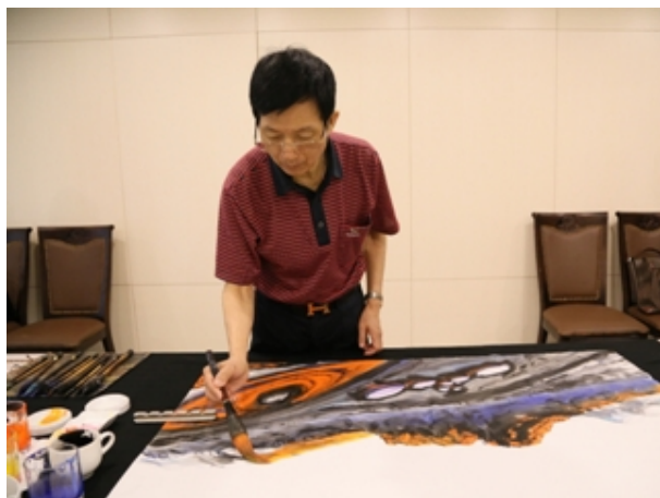
▲黃建南教授臨席揮毫，本校師長並於現場觀摩創作過程。

此行黃建南教授並臨席揮毫，致贈畫作予本校收藏，題為「高原樂章」，本校師長並於現場觀摩創作過程，郭校長艷光表示很榮幸能夠近距離欣賞大師作畫過程及畫作風采，本校美術系師生經常舉辦各種展覽，創作能量豐沛，近來也策劃兩岸藝術交流展覽，期待未來本校有機會能夠再次邀請大師來訪，使本校學子能夠親自聆聽大師對於藝術及美學教育的看法及理念，獲致更豐富的美學體驗與藝術收穫。（秘書室）