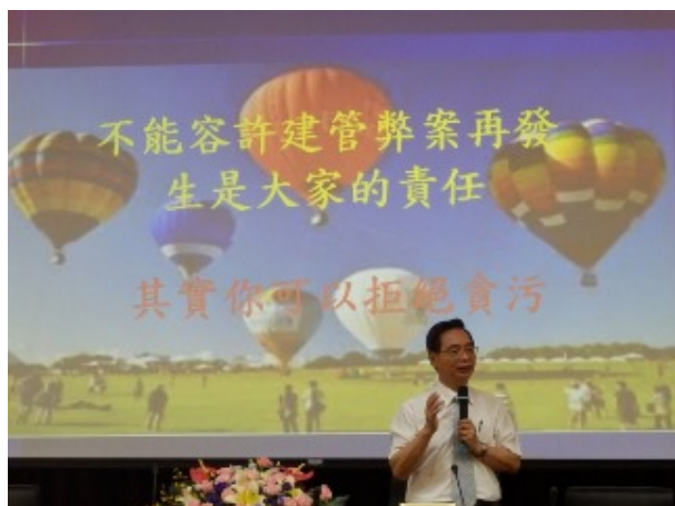
▲廉政署朱署長坤茂蒞臨活動現場分享自身經驗。