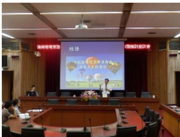
▲建築管理業務所涉之廉政議題（含行政透明措施）及意見交流。