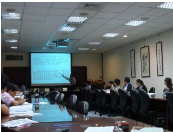
▲縣府及各鄉鎮市公所建築管理人員及彰化縣政風機構主管人員聽講情形。