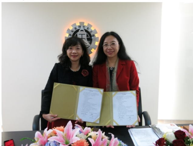
▲教育學院與北京理工大學人文與社會科學學院簽署合作交流協議書。