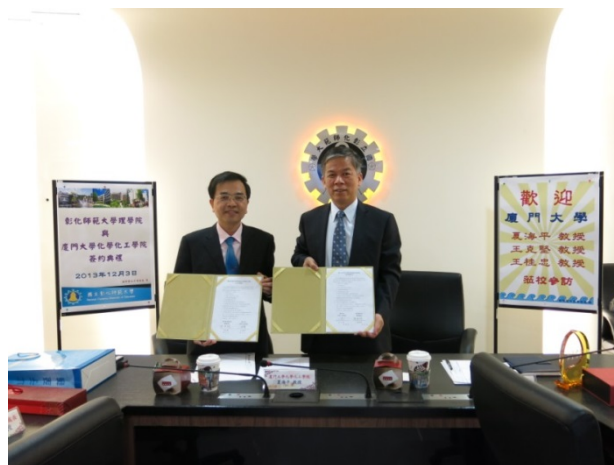
▲理學院與廈門大學化學化工學院簽署合作交流協議書。