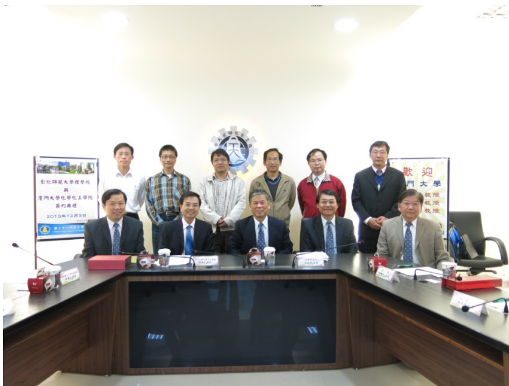
▲廈門大學化學化工學院與本校理學院簽約典禮全體師長合照。