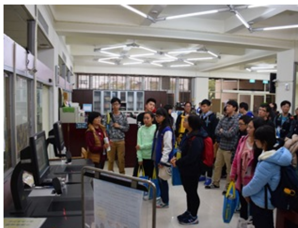
▲訪問團師生參觀本校圖書館。