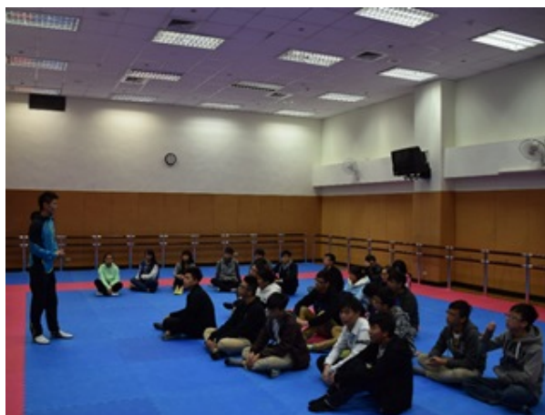
▲訪問團學生參觀運動學系場館。