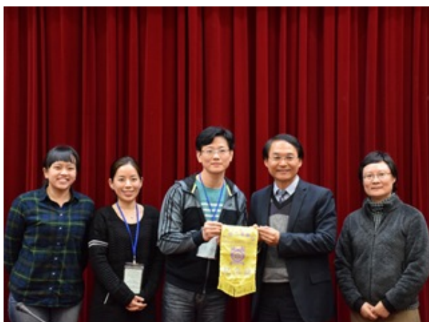
▲郭校長（右二）與官立中學師長合影。