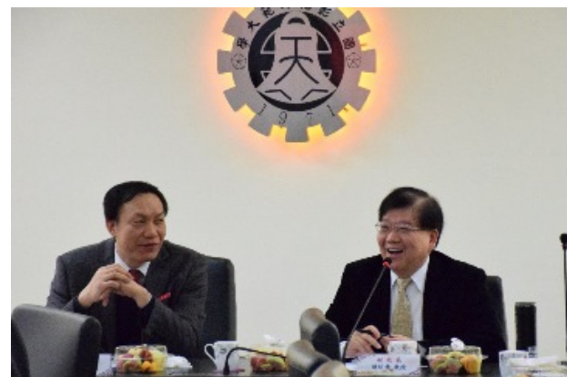
▲本校陳副校長（右）與龍岩學院劉副校長於座談會中交流