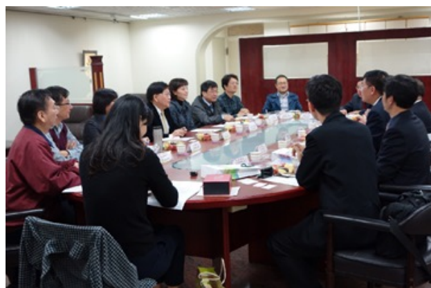
▲本校陳副校長（左五）主持與武夷學院交流座談。