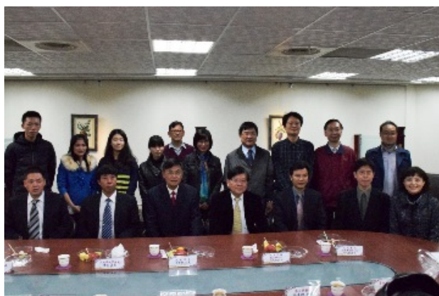
▲本校師長、武夷學院訪客及交換生合影。