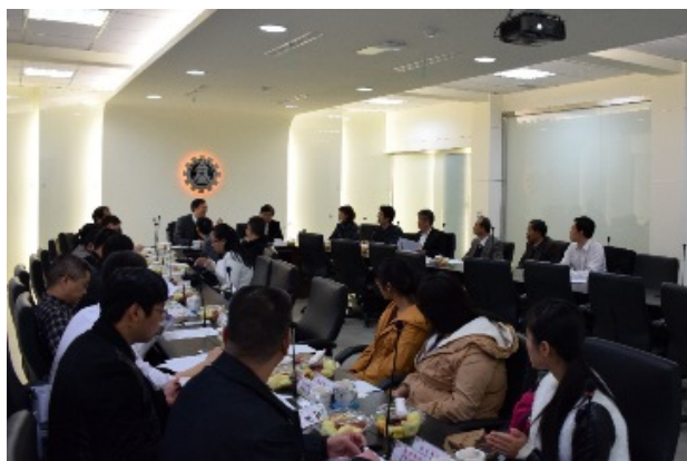
▲本校與龍岩學院交流座談會一景。