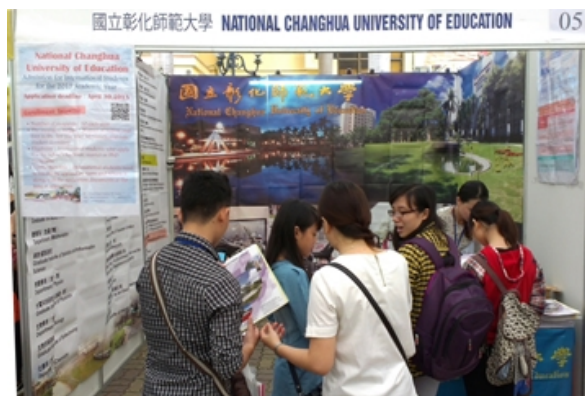
▲本校於教育展會場吸引許多優秀越南學子前來索取就學資訊，期待深入瞭解本校卓越的高等教育品質與友善的學習環境。