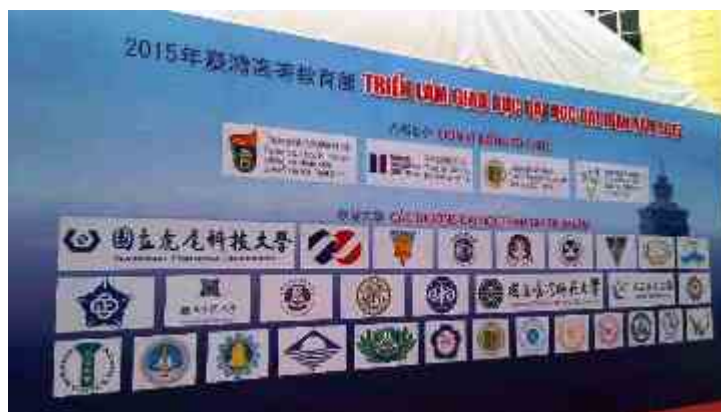
▲2015 越南臺灣高等教育展共 30 所學校參展。