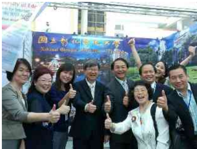
▲教育部吳部長思華（左四）、國際及兩岸教育司楊司長敏玲（左一）親臨本校攤位加油打氣。

為增進越南對臺灣高等教育之認識，強化臺灣與越南高等教育之交流，本校郭校長艷光親自偕同語文中心洪主任贊凱、教務處及國際暨兩岸事務處團隊前往越南參展、拜訪及交流，19日中午與外交部駐越南台北經濟文化辦事處黃代表志鵬餐敘，是日下午與高伯適中學、武橋興執行長及該校學生會會面，郭校長勉勵並歡迎越南優秀學生申請來彰化師大就讀或進修；是日晚宴則由郭校長、高伯適中學校長、洪主任贊凱及阮秉謙高級行政專員商議阮秉謙高級中學於4月13日率6人師長團至本校參訪事宜。