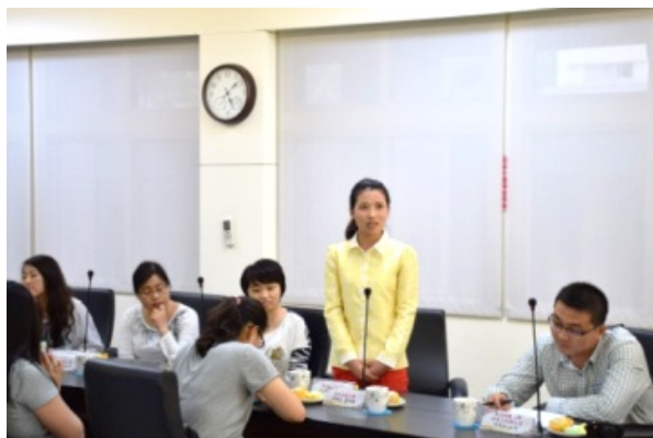
▲西北師大交換生發表來臺心得。