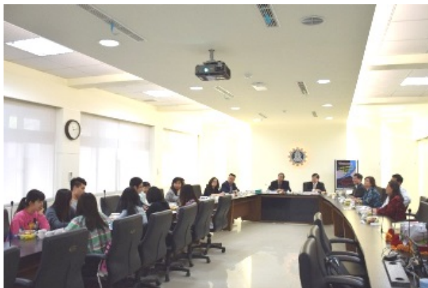
▲北京聯大蒞校參訪歡迎會一景。