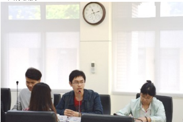
▲北京聯大交換生（右三）代表發表來臺心得。