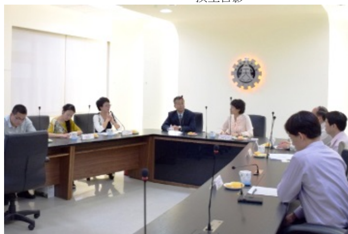
▲西北師大蒞校參訪歡迎會一景。