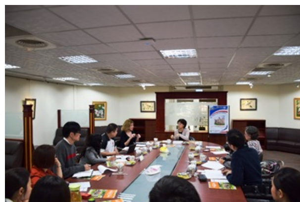
▲本校師長與來賓研商雙聯學制合作事宜。