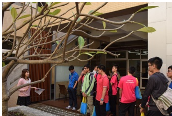
▲心誠中學學生參觀本校圖書館。