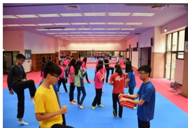
▲心誠中學學生於運動系實地操練。