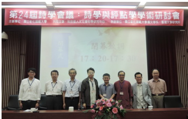
▲第四場研討會結束及閉幕合照。