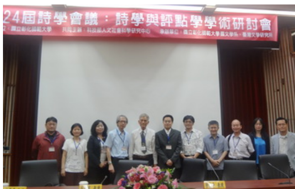
▲第一場研討會結束合照。