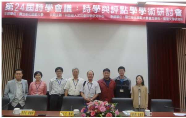
▲第二場研討會結束合照。