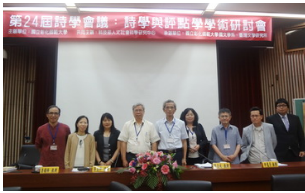
▲第三場研討會結束合照。