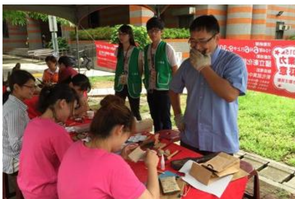
▲民眾參與名師高徒一木我齊遇記（木雕活動）。