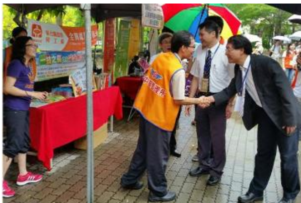
▲參訪中區監理所攤位。