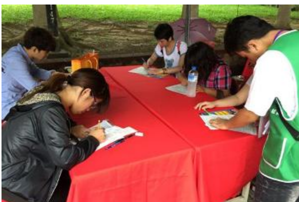
▲求職應屆畢業生填寫履歷。