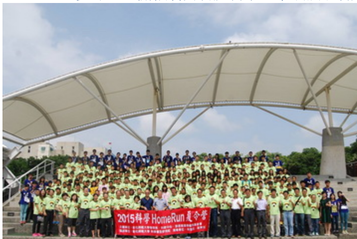
▲科學 HomeRun 夏令營全體合影。

「有狗，有狗...有夠好玩的」，104年7月6日至11日，本校與維力公司張君雅基金會共同舉辦二梯次「關懷弱勢學童－科學 HomeRun 夏令營」，讓弱勢學童也可以參加科學活動，藉由動手做科學的趣味活動，進而愛上科學。夏令營活動以生活中的科學為主，讓科學更親近學生的生活，藉此開闊學生們的眼界，激盪他們腦力，合作解決問題的能力。