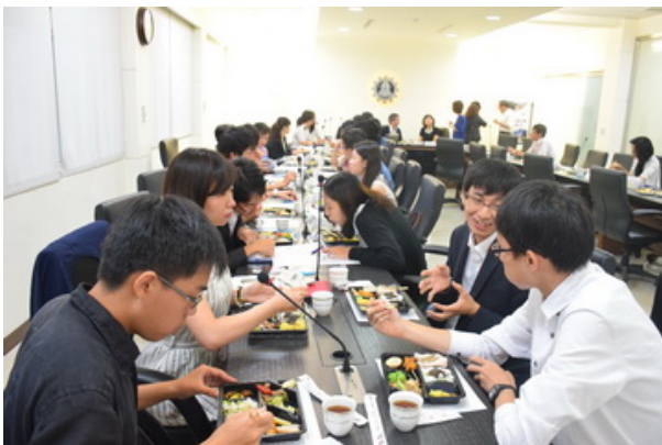
▲臺日師生近距離互動交流。