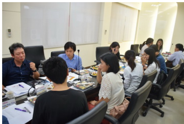
▲臺日師生近距離互動交流。