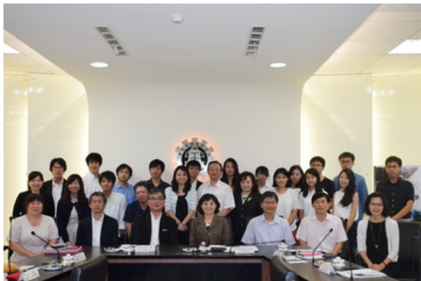
▲本校師生與來賓於交流會後合影。