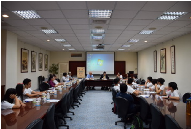
▲交流座談會會議一景。