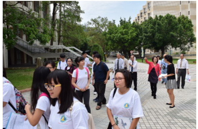
▲來賓走訪本校校園。