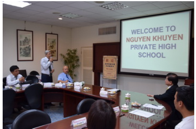
▲阮勸中學校長（左二）介紹該校。