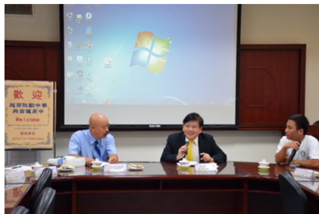
▲陳副校長（右）主持交流座談會。