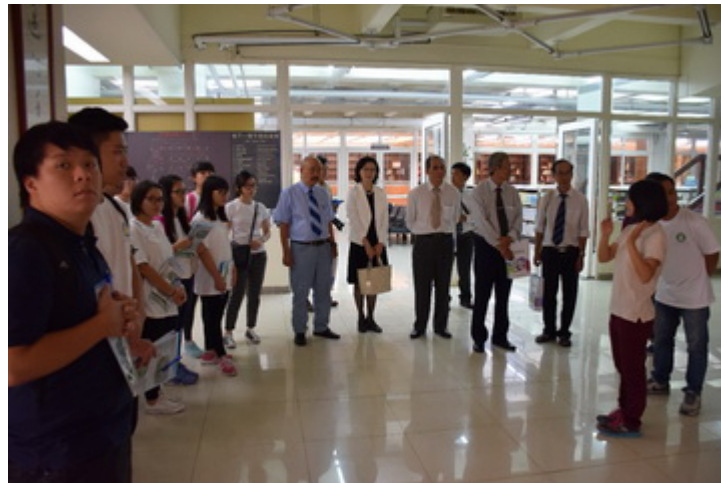
▲來賓參觀本校圖書館。