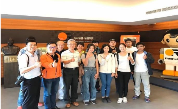
實地參訪-台中精機