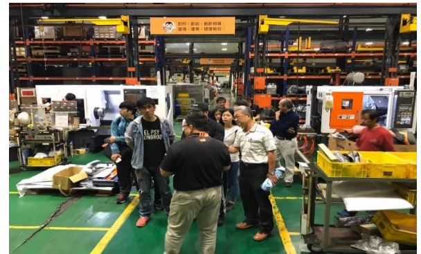
實地參訪-台中精機