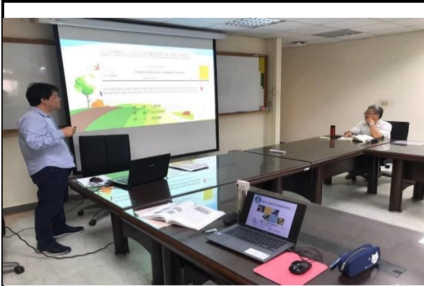
問題導向單元報告

本教學研究架構是以選修工具機與模治具專題研究課程的博士班研究生為主要對象，探討在不同之專業背景下使用問題導向與混成學習為核心教學法在小組的學習及問題引導與解決問題之能力。本研究在課程實施前先針對修課之博士班研究生進行研究案說明，並請受試研究生簽署研究參與者同意書。在執行研究的過程中，以問題導向與混成學習之教學方法進行教學實驗，在研究過程中，研究者為使受試研究生能與產業界進行連結，安排至台中精機進行企業參訪活動，活動中使受試學生能針對課程中所面臨之問題，與企業界進行交流，以解決相關問題，課程實施與參訪活動相關活動如圖三所示。